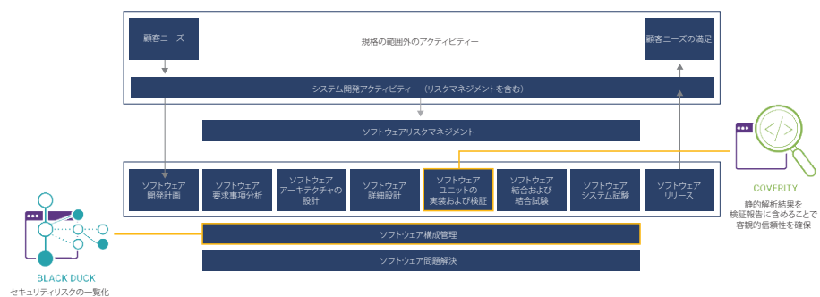
図 2 「Coverity」と「Black Duck」が担う工程 (AI メディカルサービス資料を基に編集部で作成)